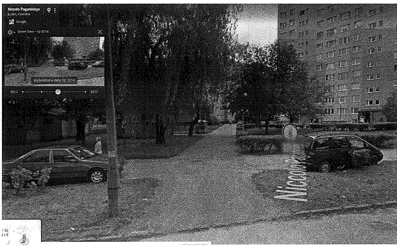
wjazd na ul. Paganiniego po remoncie – wysokie na kilkanaście cm krawężniki w ciągu chodnika