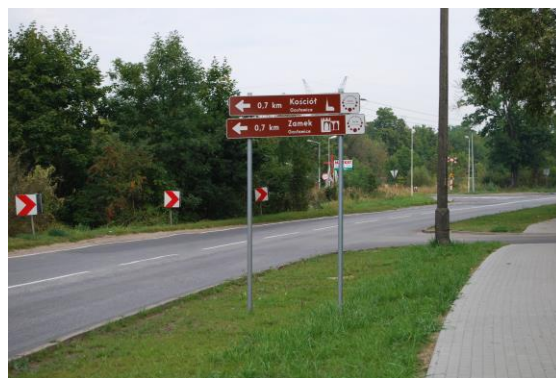
ul. Przemysłowa – Gosławice