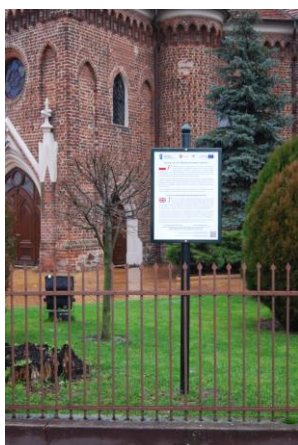
Kościół pw. Św. Andrzeja Apostoła

Na terenie miasta oznakowane są trzy obiekty, w ramach wspólnego projektu z Wielkopolską Organizacją Turystyczną pt. „Opracowanie regionalnych produktów turystyki kulturowej i ich promocja”