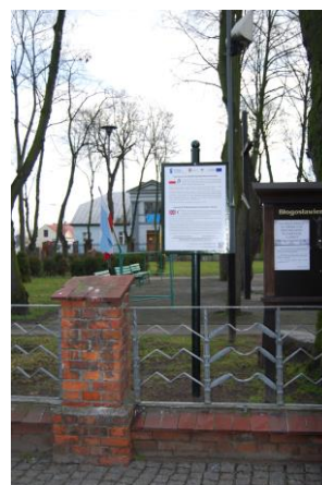
Kościół pw. św. Bartłomieja