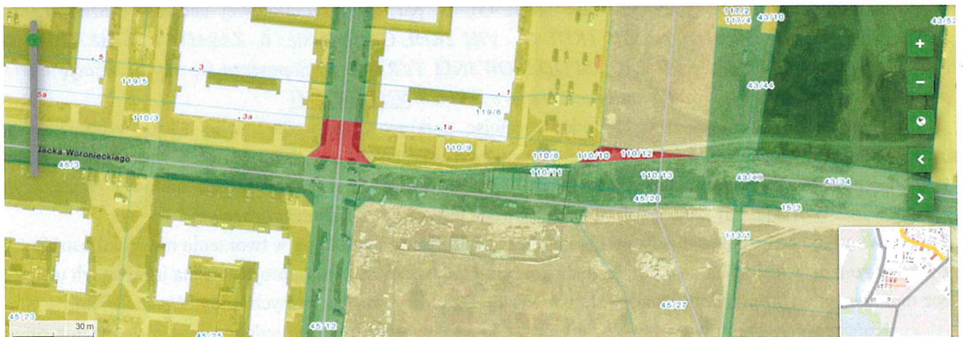
Rys. 2. Mapa własnościowa ukazująca podział nieruchomości w pobliżu Woronieckiego 1a