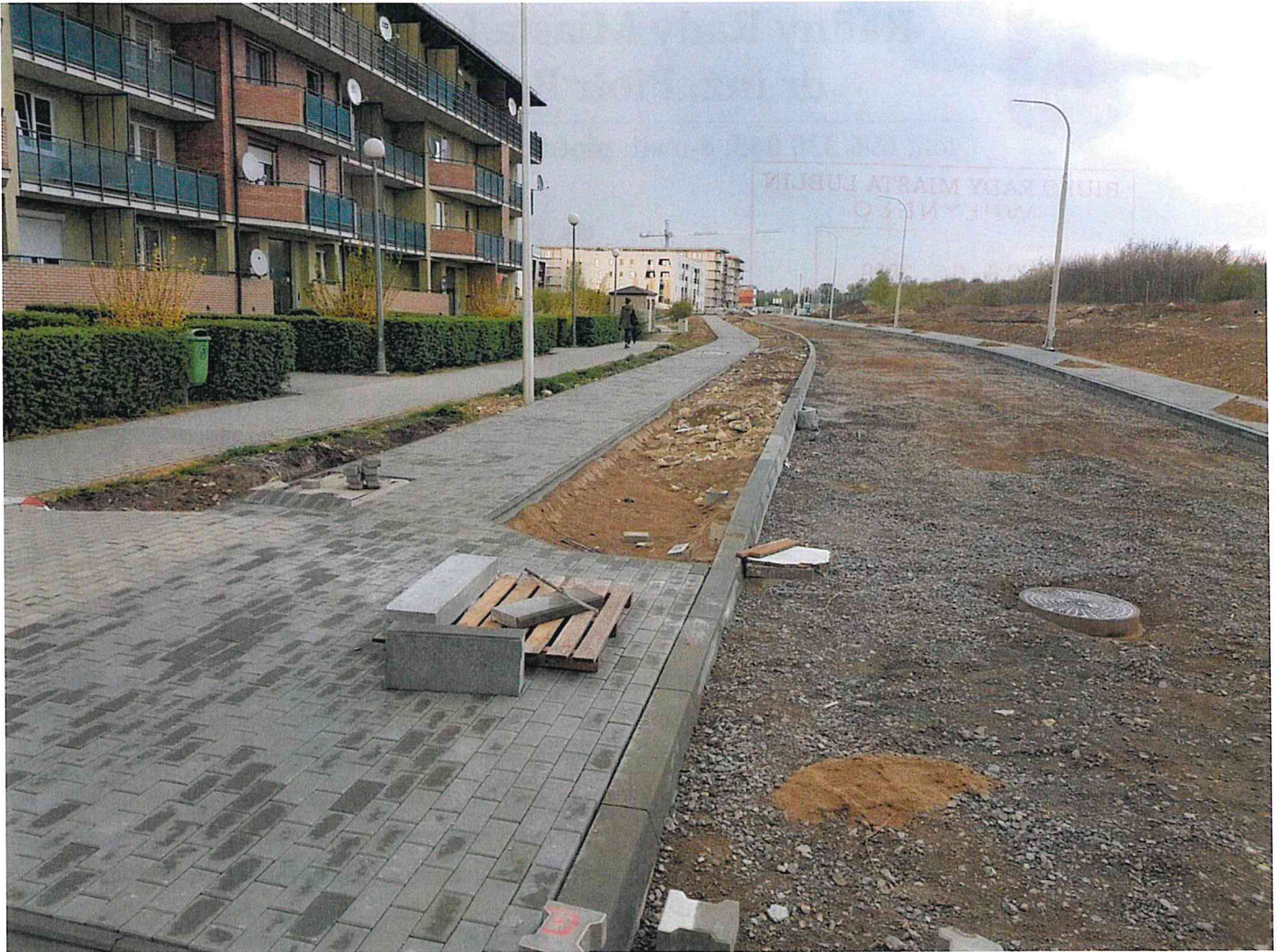
Rys. 1. Aktualnie trwające prace budowlane na ulicy Woronieckiego/Granata